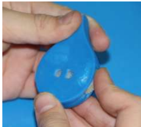
Изготовление прототипов на 3d принтере