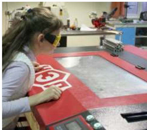
Вырезание на лазере