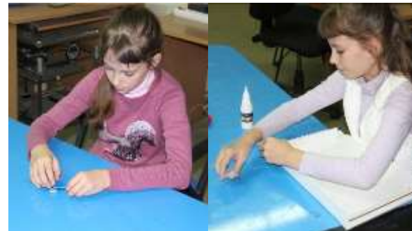
Сборка и упаковка