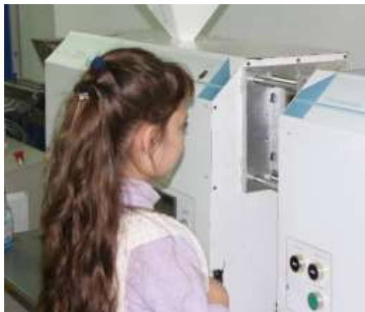
Изготовление комплекта игры