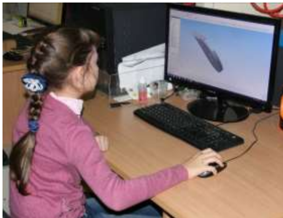
Создание моделей в Компасе